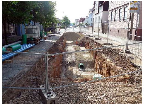
Die Bundesregierung hat eine Reform des Vergaberechts beschlossen.