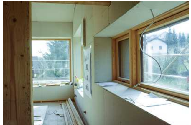
Aktuell haften die Handwerker für die Ausbau- und Wiedereinbaukosten bei Produktmängeln selbst.

Der Fall des Landauer Fensterbauers Volker Odenbach ging durch die Presse. Der Unternehmer hatte bei einem Kunden mehrere Fenster mit Stahlrahmen eingebaut die nun rosten. Dies ist auf einen Produktionsfehler des Herstellers zurückzuführen. Für den Aus- und Wiedereinbau muss allerdings nicht der Hersteller sondern Volker Odenbach haften. So wie dem Fensterbauer geht es zahlreichen Handwerkern in Deutschland. Die aktuelle Regelung ist eine Existenzbedrohung für viele Betriebe. Im Koalitionsvertrag vereinbarten CDU/CSU und SPD, dass eine handwerksfreundliche Regelung getroffen werden sollte. Der Bund der Selbständigen Deutschland hat sowohl im Rahmen einer mündlichen Anhörung im Bundesministerium der Justiz und