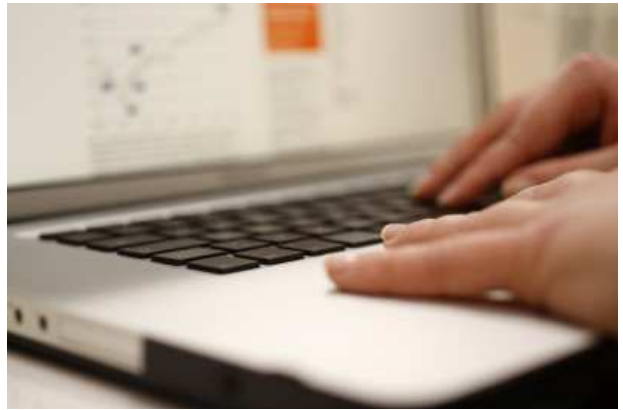
Im IT Bereich werden häufig Wartungsverträge geschlossen.