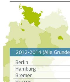
Gründerquoten nach Bundesländern – Stadtstaaten wieder gemeinsam führend

Gründerquoten: Anteil der Gründer an der jeweiligen Bevölkerung im Alter von 18 - 64 Jahre.