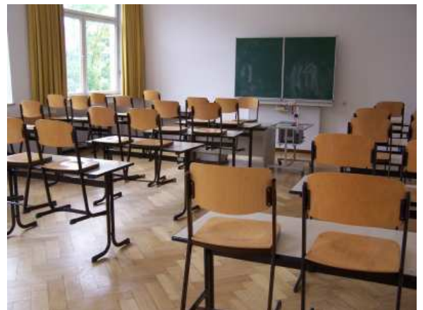
Bund und Länder wollen stärker in Bildung investieren.

Deshalb müssten die Länder begreifen, dass sie in der Schulpolitik eine klare Linie verfolgen müssen. „Wenn alle paar Jahre Schulformen neugeschaffen, abgeschafft oder umgestellt werden, kann das nicht funktionieren und es kostet einen Haufen Geld, das man sicher besser investieren könnte“, so die BDS Präsidentin.