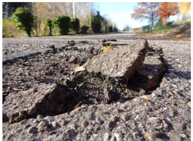
Viele Straßen in Rheinland-Pfalz sind in schlechtem Zustand.