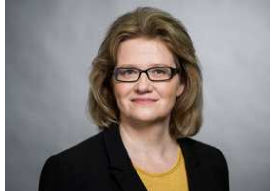
Anette Kramme, parlamentarische Staatssekretärin im Bundesarbeitsministerium.