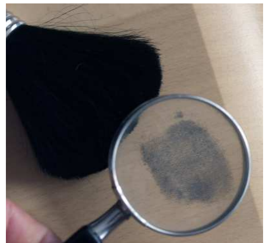
Einbrüche werden nur selten aufgeklärt.