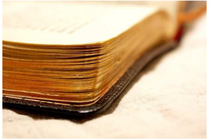
Buchbindereien leiden unter Niedriglöhnen in Justizvollzugsanstalten.